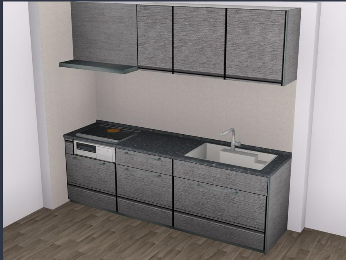
画像はイメージです。