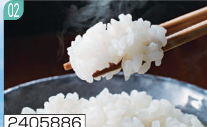
2405886 奥能登産 ひやくまん穀 5kg

石川県奥能登産ひやくまん穀5kg 賞味期間：50日（残日数20日以上）（常温） 通常便 ※お米の賞味期間は精米時期表記の為、目安の日数になります。