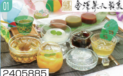
2405885 金澤兼六製菓 バラエティデザートギフト

加味ゼリー・輪島塩ゼリー各52g×各2、水羊羹小倉60g×4、水羊羹練り・水羊羹抹茶各60g×各2、梅酒ゼリー・輪島塩入り檸檬ゼリー各75g×各4、プレミアムマンゴープリン・蜂蜜入り柚子ゼリー各75g×各2 賞味期間：180日（残日数120日以上）（常温） 通常便