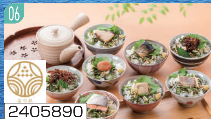
2405890 かね七「なつれ」海鮮茶漬けセット

富山湾産ぶり茶漬け、富山産さくらます茶漬け、紀州産南高梅茶漬け、長崎産まだい茶漬け、瀬戸内産小尻山椒茶漬け、北海道産はたて茶漬け、北海道産にしん茶漬け、首戸産ちりめ山椒茶漬け×各1(計8)(だしつゆ30g、茶漬け菜味0.5g付) 賞味期間：180日（残日数120日以上）（常温） 通常便