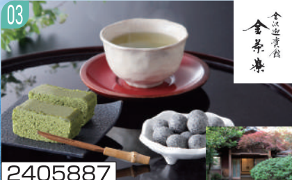
2405887 金沢迎賓館 金茶寮 監修 抹茶ケーキアソート

抹茶ケーキ×2、黒ごま豆菓子45g×2、深蒸し茶ティーバッグ(2.5g×5)×2 賞味期間：180日（残日数90日以上）（常温） 通常便