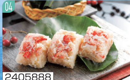
2405888 加賀「いしの屋」本ずわい蟹めし